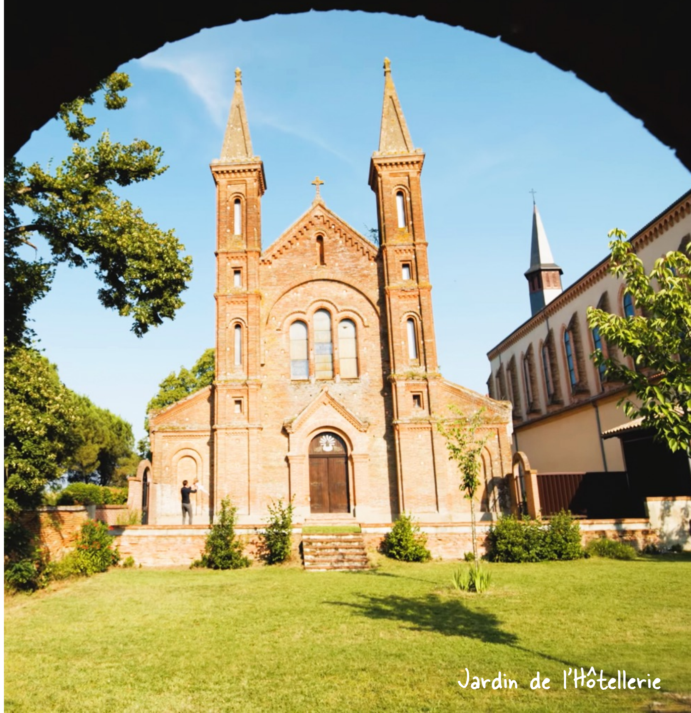
Jardin de l'Hôtellerie

Actuellement 5 emplois et demain 14 nouveaux postes dont prévus dont 8 destinés à des personnes éloignées de l'emploi sous 3 ans.