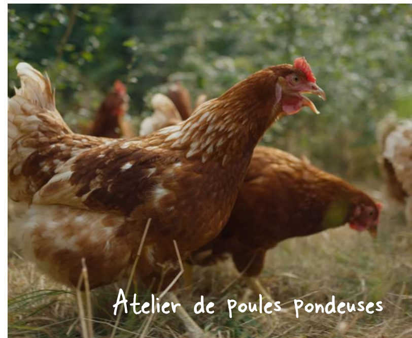
Atelier de poules pondeuses